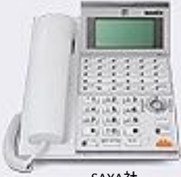
SAXA社 IP NetPhone SX